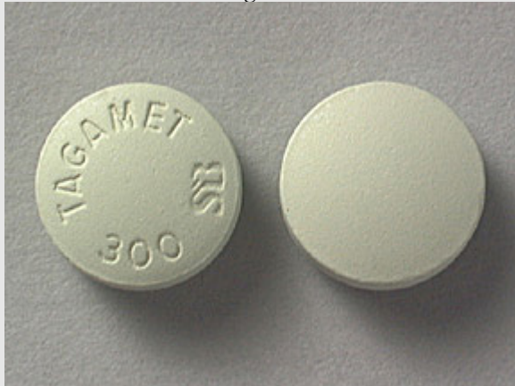
Benelux inschrijving 0374652