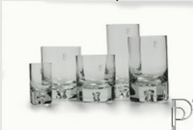
Glazen van Palma