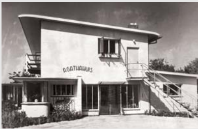
Pagina 70: Foto Jan Kamman