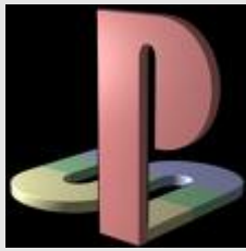
Sony Playstation 3