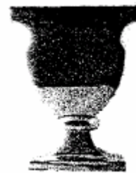
Alu Baroque vaas

2.7. Onlangs constateerde Brass en Boom dat door Loods 5 een model vaas wordt aangeboden die volgens Brass en Boom grote gelijkenissen vertoont met de Brass en Boom grote gelijkenissen vertoont met de Brass en Boom vazen. Deze vaas wordt aangeduid als de "Alu Baroque" en wordt eveneens vormgegeven als een oversized, aluminium bokaal/kelkvorm, geplaatst op een voetstuk met ovaalvormig tussenstuk en met een rechthoekige omtrek. Brass en Boom heeft op 12 maart 2007 een dergelijke vaas bij Loods 5 aangekocht. De door Loods 5 aangeboden vaas is hierna afgebeeld.