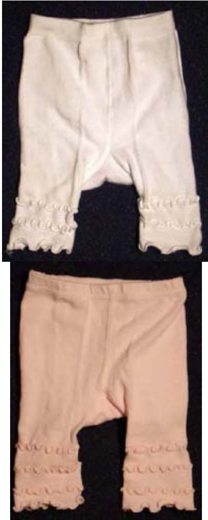
4.12. De leggings worden aangeboden in een verpakking zoals hiernaast afgebeeld, links de Apollo legging van Anglo met vier (sic) randjes en rechts de Legging van Bonnie Doon met drie randjes.