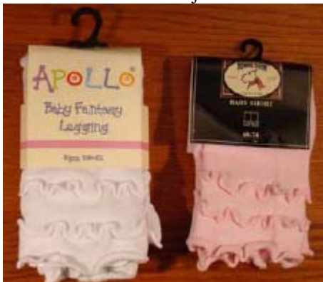
4.11. Anglo betwist, zo begrijpt de voorzieningenrechter, dat Bonnie Doon door het modeldepot van een legging met driekartelrandjes een modelrecht krijgt met een beschermingsomvang dat zich uitstrekt tot het aanbrengen van kartelrandjes in het algemeen op leggings. Dit gaat volgens Anglo te ver gelet op het gegeven dat kartelrandjes ten tijde van het depot al op grote schaal in de mode werden toegepast.

4.12. De voorzieningenrechter overweegt dat het modelrecht van Bonnie Doon geenszins impliceert dat Bonnie Doon een algeheel monopolie heeft verkregen