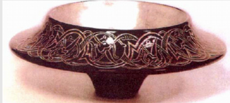
versus Vaas B