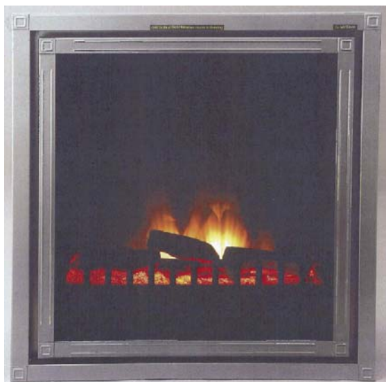
Afbeelding 3c.Flamestore Deca Design (met streepjes)