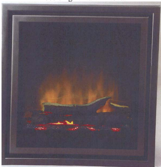
Afbeelding 2. DSL 2000 A3: