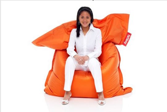
Sitting Bull Sitzsack