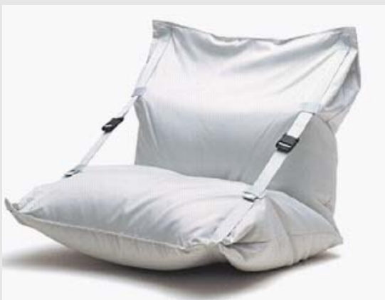
Schetsontwerp Setäla 1998 1