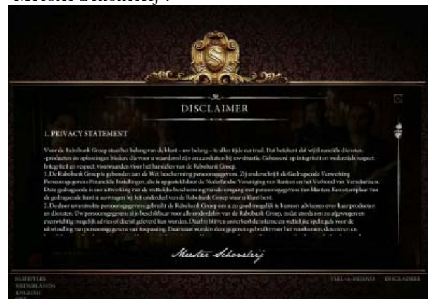
Fig. 5: deel van de disclaimer onderaan de website www.schoneleij.nl

2.8. Alleen voor degene die dit hele traject (met tekst invoer) aflegt zou de (uiteindelijke) verwijzing naar www.rabosparen.nl misschien duidelijk kunnen maken dat de Inbreukmakende Commercial een dienst van Rabobank en de daaraan verbonden ondernemingen betreft. De gemiddelde gebruiker ziet echter slechts de Inbreukmakende Commercial op de website. Wie goed doorzoekt, komt uit bij de ‘disclaimer’ onderaan in het scherm, waaruit wellicht kan worden afgeleid dat Rabobank Groep deze campagne heeft (laten) voeren. De disclaimer is echter opnieuw ondertekend met ‘Meester Schoneleij’: