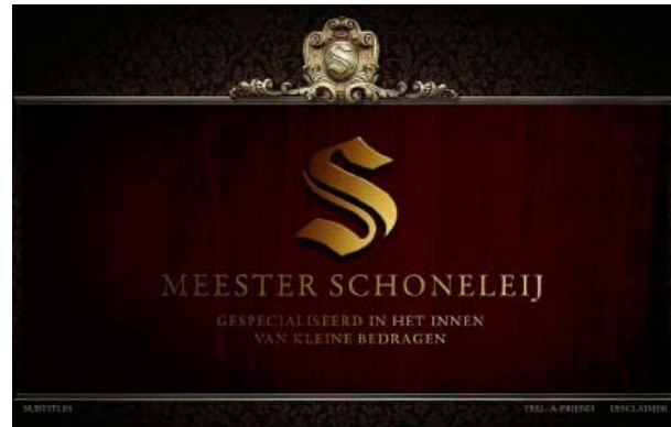
Fig. 4: afbeelding “Meester Schoneleij” aan het eind van het fragment

e. Daarna komt de (handels)naam van Meester Schoneleij in beeld: