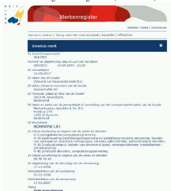
Fig. 1: inschrijving van het woordmerk SCHOONE LEI

1.5. Schoone Lei heeft haar diensten in de Benelux merkrechtelijk beschermd; zij is houdster van het Beneluxmerk met inschrijvingsnr. 0611583 m.b.t. het woordmerk SCHOONE LEI, waarvan hierna een print uit het merkenregister is afgebeeld (“het Merk”):