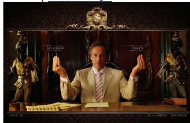
Fig. 2: still uit de Inbreukmakende Commercial met Meester Schoneleij

2.3. In één van genoemde films wordt het personage Meester Schoneleij neergezet, een persoon die zegt dat hij vorderingen altijd kan incasseren (hierna, tezamen met de daarmee verbonden hierna te omschrijven interactieve filmfragmenten: “Inbreukmakende Commercial”). De Inbreukmakende Commercial beschikbaar op www.schonelej.nl .