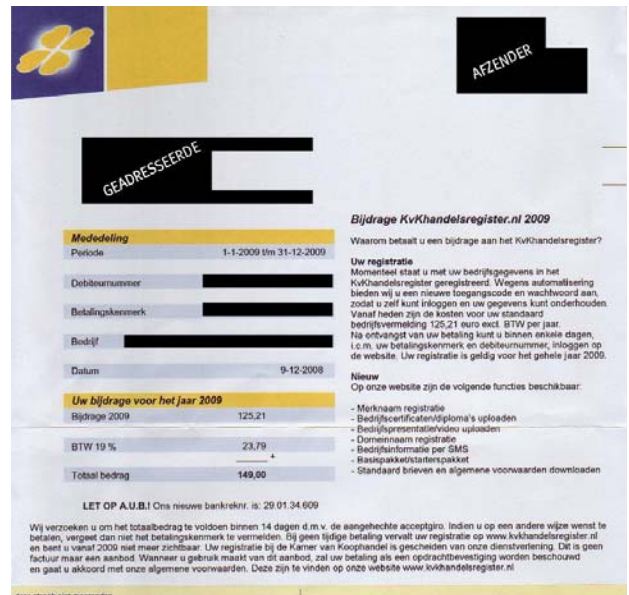
11. En hieronder een afbeelding van de originele factuur van de KvK:

10. Hieronder wordt een afbeelding getoond van een verzonden factuur door Kantoor voor Klanten: