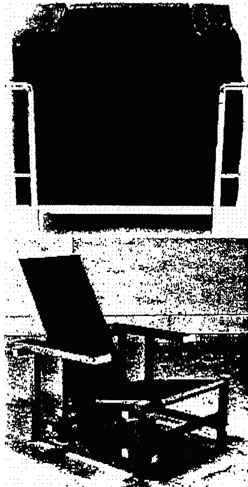
Afbeeldingen afkomstig van website Dimensione

Op de website staan onder meer modellen (met foto) die te koop worden aangeboden met de aanduidingen 'LC4 Liege, LC2 Sessel, LC 2 2-Sirzer, LC 2 3-Sitzer, LC 3 Sessel, LC 3 2-Sitzer, LC 3 3-Sitzer, LC6 Tische en Basculante' alsmede een model dat wordt aangeduid met 'Rietveld Wood' voor € 599,-.