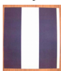
Dutch Delight 4840-5