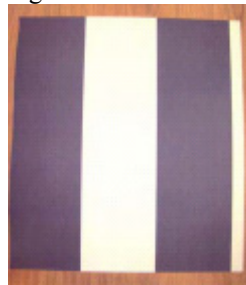
Dutch Delight 4840-4

2.4. Recentelijk heeft Spits onder de naam Dutch Delight behang op de markt gebracht in de hieronder afgebeelde dessins: