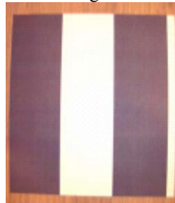
Dutch Delight 4840-3