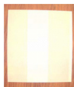
Dutch Delight 4840-2