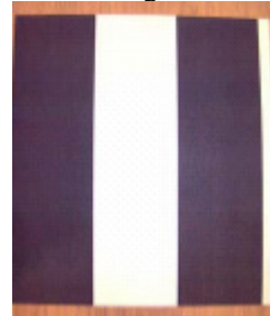
Dutch Delight 4840-7