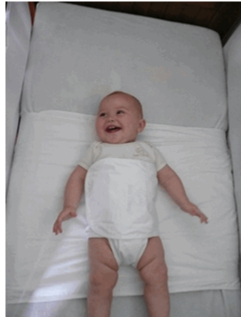
Bijlage B: de Snoozzz

Dit vonnis is gewezen door mr. Sj.A. Rullmann, voorzieningenrechter, bijgestaan door mr. E. van Bennekom, griffier, en in het openbaar uitgesproken op 12 maart 2009.