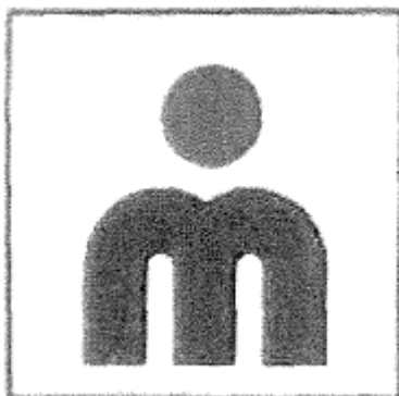
Beeldmerk van de Adviespraktijk

2.1 Adviespraktijk is eigenaar van het hierna afgebeelde beeldmerk dat sinds 23 mei 1977 is geregistreerd bij het Benelux-Bureau voor de Intellectuele Eigendom. In 1993 is een geschil ontstaan tussen partijen over het gebruik van een beeldmerk door (een rechtsvoorganger van) Boards and More dat lijkt op dat van Adviespraktijk. Bij vonnis van 25 november 1998 heeft de rechtbank Almelo het gebruik van het gelijkende beeldmerk door Boards and More verboden. Naar aanleiding van deze kwestie hebben partijen in maart 2001 een vaststellingsovereenkomst gesloten.