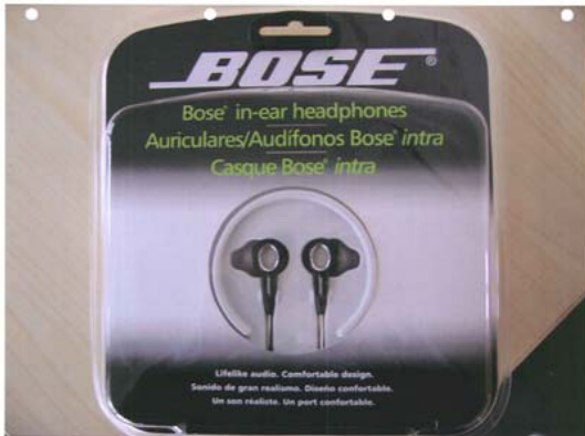
De door X aangeboden hoofdtelefoon