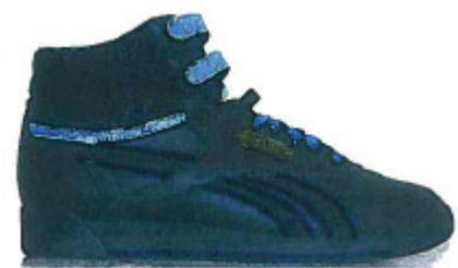
Freestyle type F/S Hi Birthstone