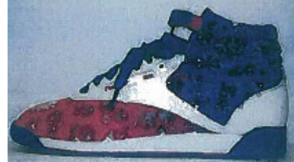
Freestyle type F/S Hi Squares