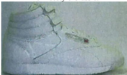
Freestyle type F/S Hi Int