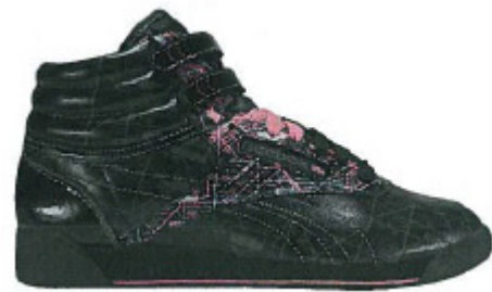
Freestyle type F/S Hi Int. Snowflake