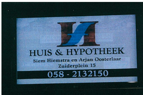
III reclame met de beeltenis van [naam]