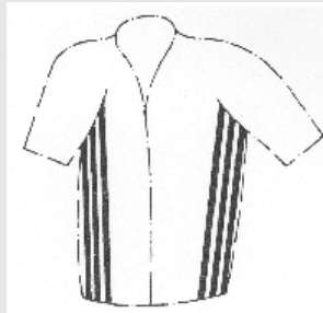
Benelux merk 325509