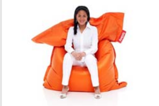
Sitting Bull Sitzsack