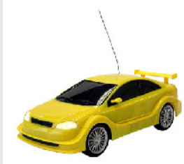
Cartronic Opel Astra schaalmodel